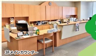
3Fメインカウンター

映画や学習に役立つDVDを図書館内で利用できます。 学生証、DVDのケースを3Fカウンターへ持っていき 手続きをしてください。