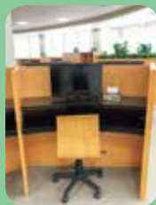
1人で観るための個人ブース