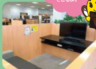
2~3人で観るためのグループブース