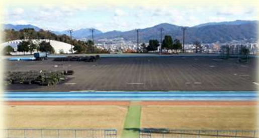
陸上競技場の人工芝張り替え工事の様子