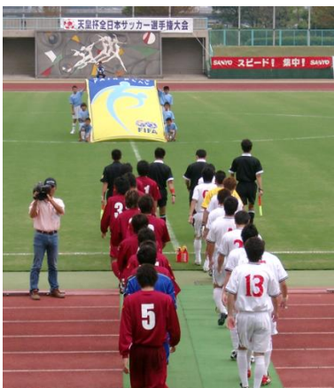
□エンジ(左)が広経大サッカー部

は9月23日、全国12場で行われ、広経大サッカー部は福山市の竹ヶ端運動公園陸上競技場で徳島県代表の三洋電機徳島と対戦。スタンドからのサッカー部員、護者・OB、学長をはじめとする大学関係者、学会が企画した“熱血応援ツアー”(貸切バス1台)の一般学生による声援に見事応え、4-0で完勝した。